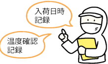
納入業者・食材の品質管理

子どもたちに安全な給食を提供するために、国のガイドラインに沿った衛生管理を行っています。各工程で、決められた内容を実施し、記録しながら作業を行うことで安全性を高めています。