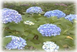
紫陽花見学！高塔山から市内を一望☆