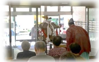
金刀比羅神社秋季神幸祭