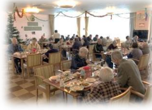
楽しいクリスマス会☆