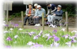
夜宮公園 菖蒲見学