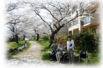
お花見へ行きました☆