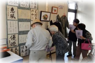
年長者作品展 見学☆